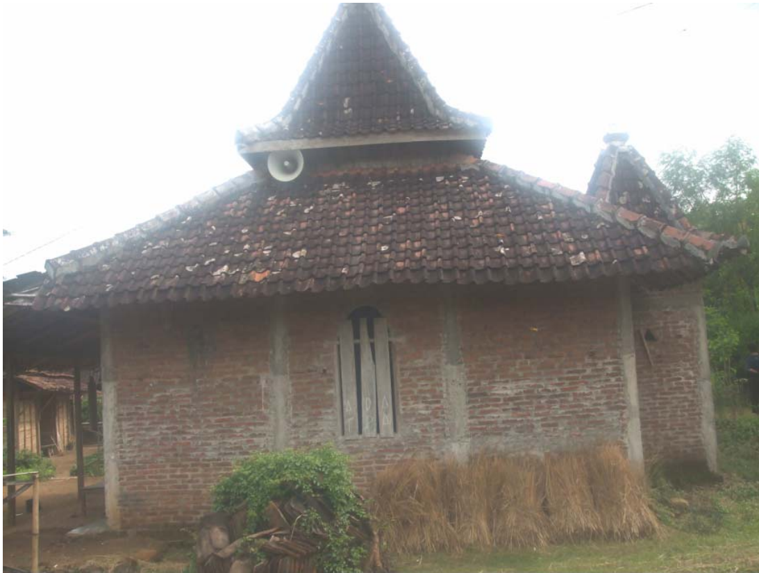
Gambar musola tampak depan