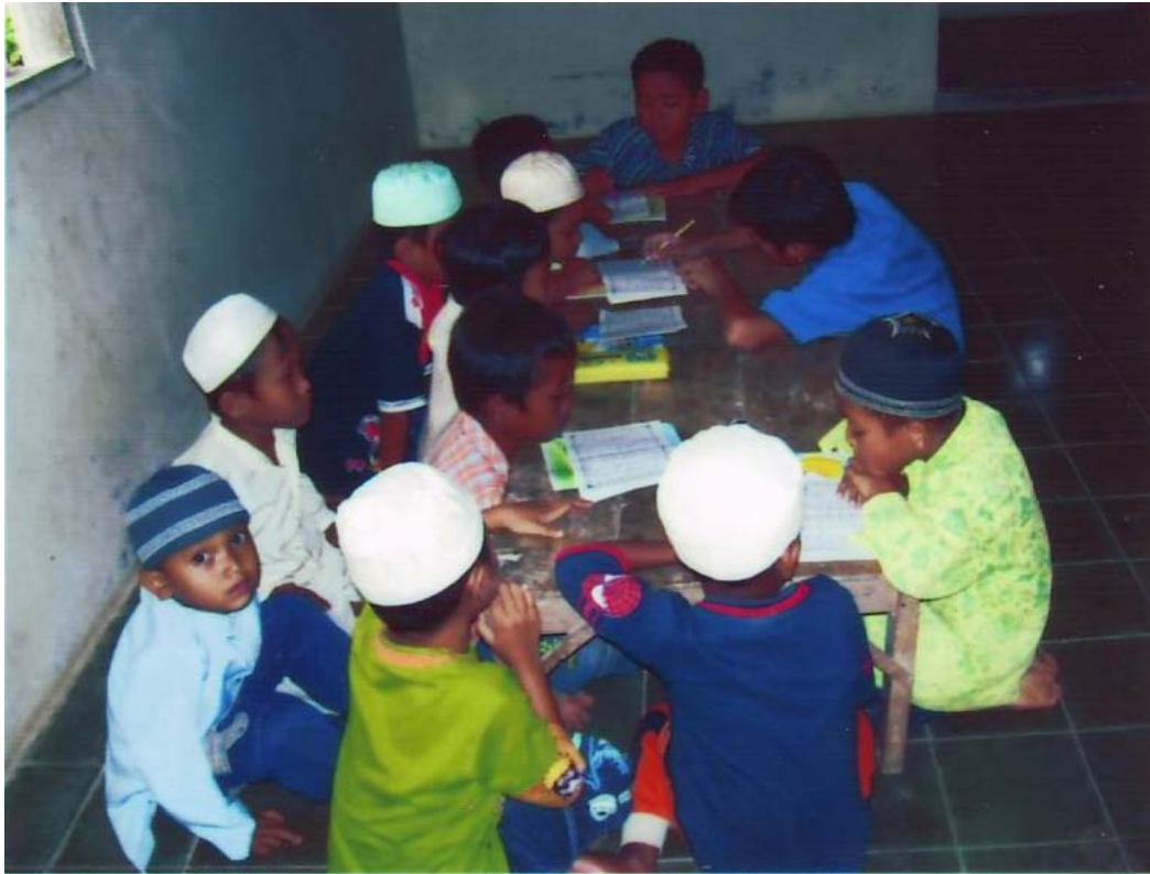
Gambar suasana mengaji anak-anak perempuan: